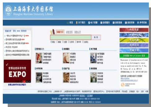
图书馆主页(第四版)运行 10 个月以来,已有近 85 万人次的点击量。