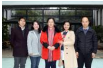
文理学院 - 学工办