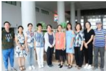
图书馆 - 学科服务部