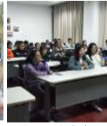
交运 - 海博学社