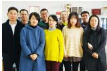
经管 - 辅导员办公室