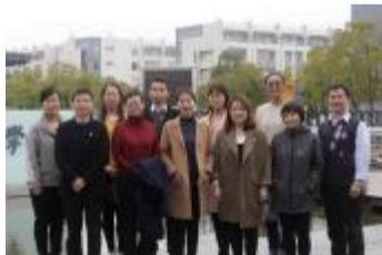
机关 - 人事处